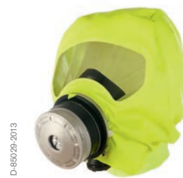
Dräger PARAT® 5500 Brandfluchthaube

Wechseln Sie nach 8 Jahren den Filter, erhöht sich die Lebensdauer auf insgesamt 16 Jahre. Dies bietet Ihnen auf lange Sicht eine große Kostenersparnis. Der Filter lässt sich nach entsprechendem Training sehr einfach eigenhändig wechseln.